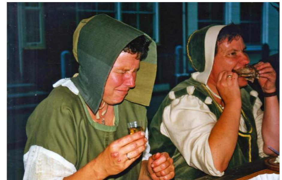
Uit het archief van Gerard de Fouw, St. Colijnsplaat foto en documentatiearchief