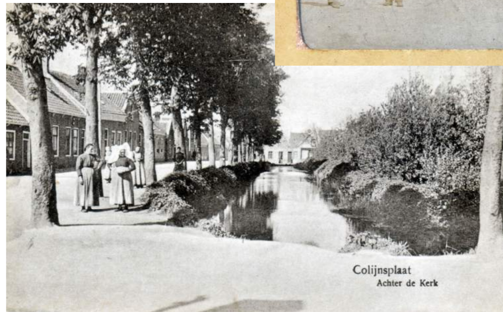
Uit het archief van Gerard de Fouw, St. Colijnsplaat foto en documentatiearchief