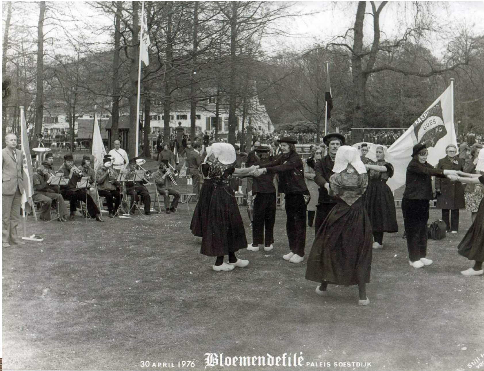
30 APRIL 1976 Bloemendefilé PALEIS SOESTDIJK